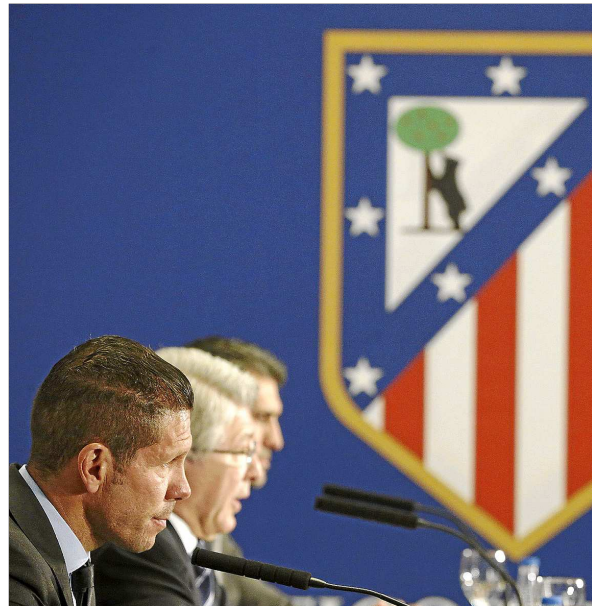
Diego Simeone, Enrique Cerezo y José Luis Pérez Caminero, ayer, durante la presentación del acuerdo.